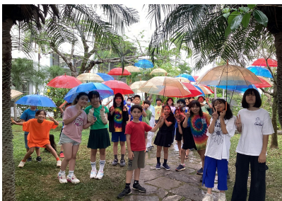
Colorful Day 5B