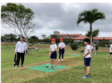
Ground golf- Yomitan