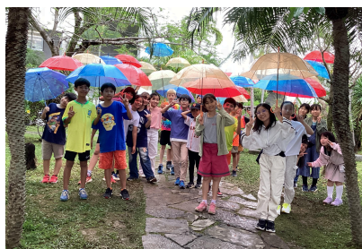
Colorful Day 5A