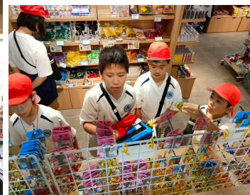
Shopping experience - Manza