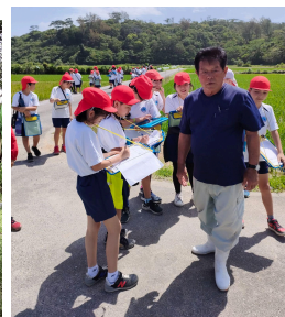
Rice field tour - Onnason