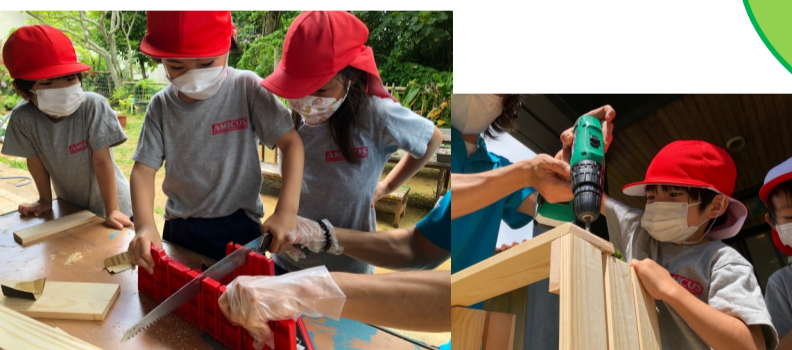
We made a shelf! お庭で使う棚作りに挑戦しました！