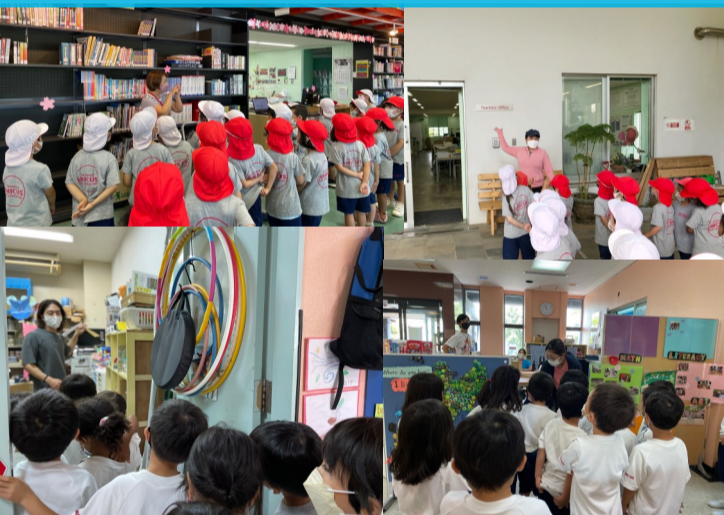
Orientation and Tour in Kinder and around AMICUS.

K2 friends were busy with many things on our first month of S.Y. 2022-2023.