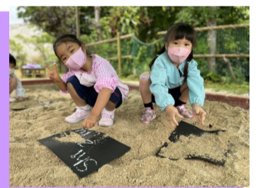
Art & Activities