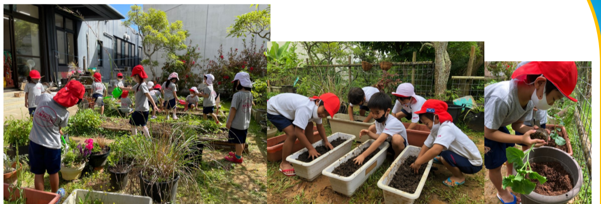
Gardening and Planting Time! Kinderの庭の手入れをしたり、野菜やお花も早速植えました！